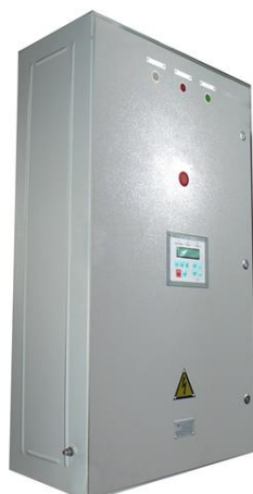
Регулятор частоты и напряжения

РЧН соответствует всем техническим требованиям Заказчика и задаваемым жёстким условиям эксплуатации. Он также подходит для всего типоряда морских турбин нового поколения. Успешная кооперация российских электротехников закрывает проблему отсутствия отечественных аналогов мощных турбин морского исполнения и позволит перейти к строительству больших океанских кораблей для ВМФ, а также современных морских судов.